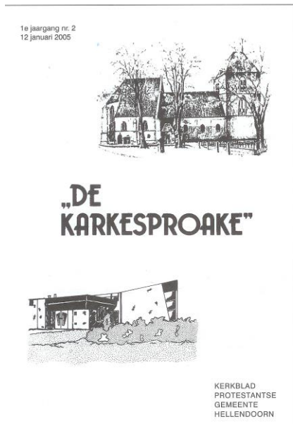
Voorkant kerkblad protestante gemeente Hellendorn

Anno 2005 draagt overigens het blad van protestant Hellendoorn nog immer de naam 'karkesproake', welke op haar eigen manier mede de gedachtenis aan dit verdwenen instituut levend houdt. Laten we ervoor zorgen dat dit unieke monument voor Hellendoorn in z'n geheel bewaard blijft, zodat we niet op foto's hoeven te laten zien hoe deze eruit gezien heeft, maar dat deze als bestaand monument mag getuigen van de historie van de vroegere nieuwsvoorziening in Hellendoorn!